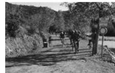
Le lac de l'Avellan

Prendre direction Fréjus RN 7 route de Cannes, au col du Testanier tourner vers le lac de L'Avellan